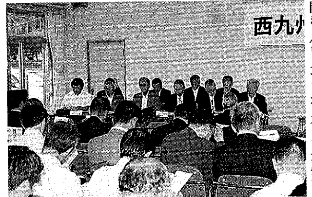
国への「カジノ特区」提案を承認した総会 —佐世保市民会館

佐世保市や佐世保商工会議所などと国に共同提案する本年度活動計画案を承認した。提案内容はカジノを認める特別法の制定。スキームは佐世保市などが施行者となり、一括受託法人が運営する公設民営。暴力団介入などを防ぐため日本人客は対象としない。試算では年間入場者数22万人、経済波及効